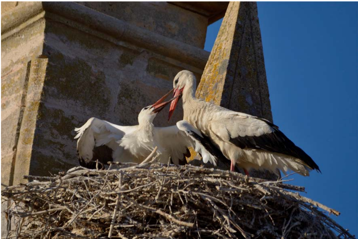
Una cigüeña blanca adulta ceba a un pollo, en un nido de la iglesia de Cascajares. (Fotografía: Héctor Miguel Antequera. 22 de julio de 2014.) (Fotografía publicada en la Hoja Informativa N° 43 sobre el Refugio, página 276.)

Dr. Fidel José Fernández y Fernández-Arroyo