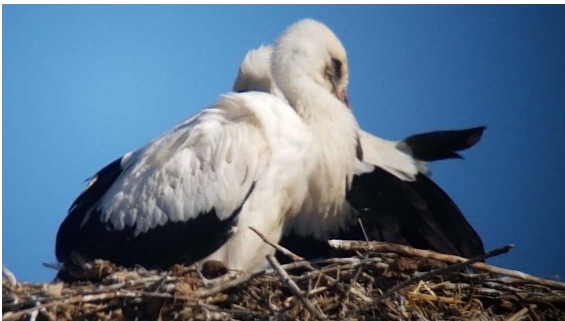
Pollos de cigüeña blanca en su nido, en Campo de San Pedro. (Fotografía publicada en la Hoja Informativa N° 57 sobre el Refugio, página 314.)