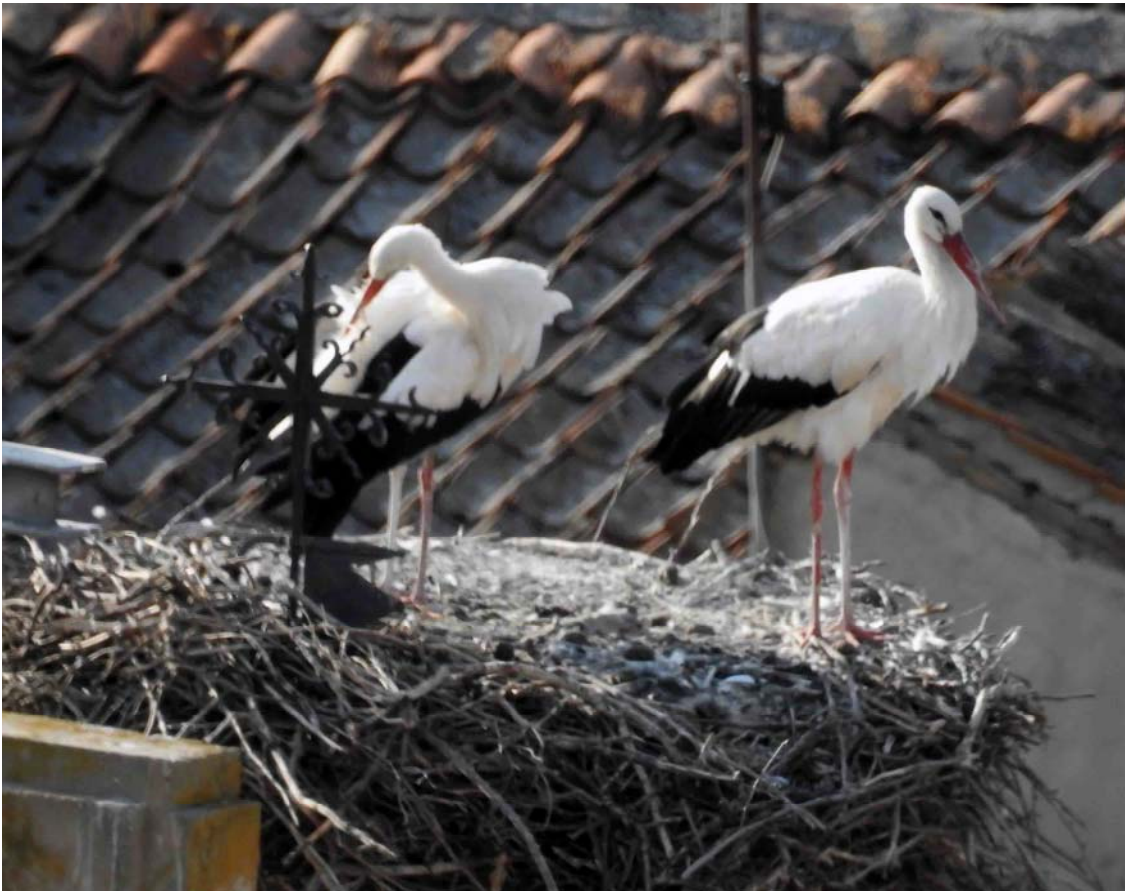
Dos cigüeñas adultas, en el nido de Montejo de la Vega. (24 de agosto de 2021.) (Fotografía publicada en la Hoja Informativa N° 57 sobre el Refugio, página 318.)