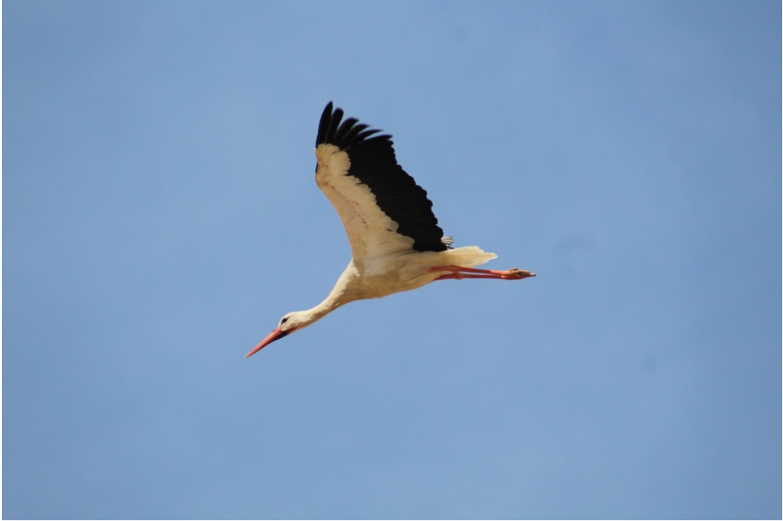
Cigüeña blanca, en la zona de Honrubia de la Cuesta. (Fotografía: Juan José Fuentenebro Martín. 14 de julio de 2021.) (Fotografía publicada en la Hoja Informativa N° 57 sobre el Refugio, página 318.)