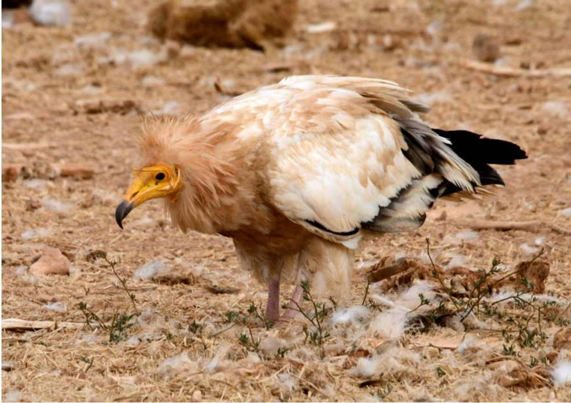
Alimoche adulto. (5-9-2013.) (Fotografía publicada en la Hoja Informativa N° 41 sobre el Refugio, página 122.)