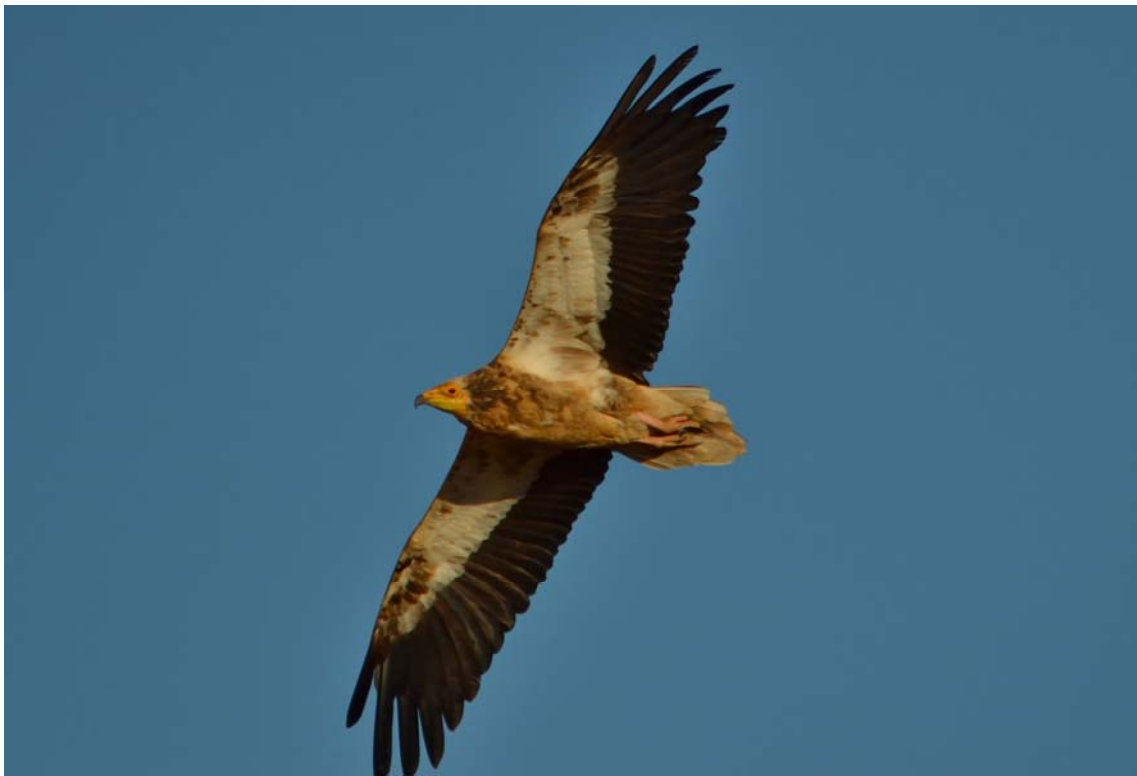
Alimoche inmaduro, del tercer año ap. (5-9-2013.) (Fotografía publicada en la Hoja Informativa N° 41 sobre el Refugio, página 132.)