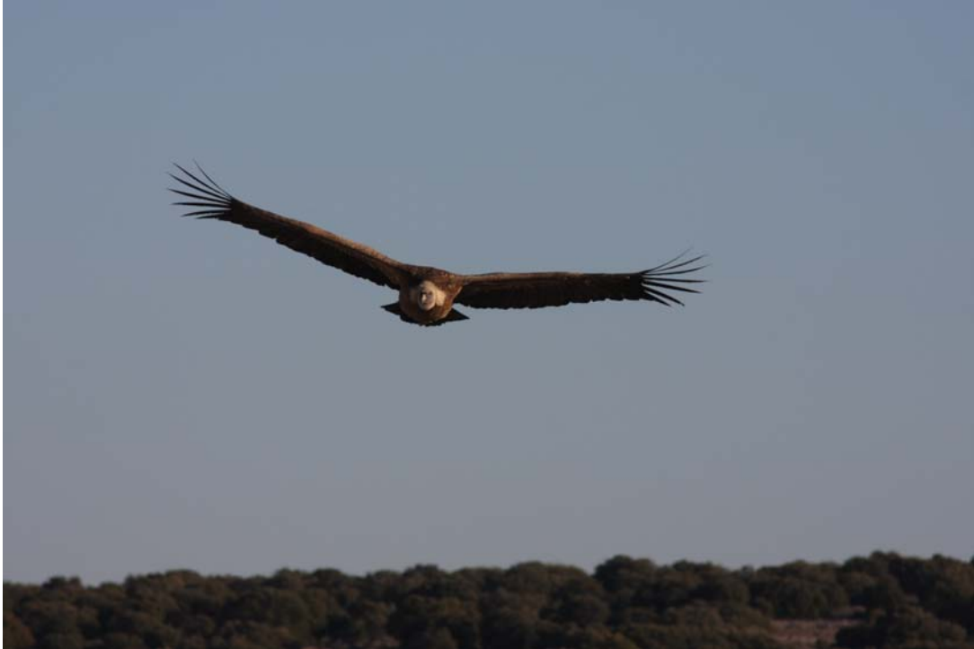
Buitre leonado, en el Refugio de Montejo. (Fotografía publicada en la Hoja Informativa N° 41 sobre el Refugio, página 269.)