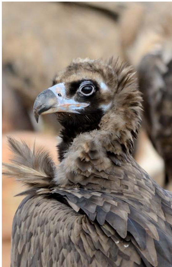
Buitre negro, en el nordeste de Segovia. (Foto: Héctor Miguel Antequera. 23-XII-2013.) (Fotografía publicada en la Hoja Informativa N° 41 sobre el Refugio, página 271.)