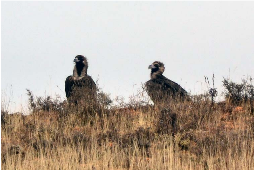
Buitres negros, en el nordeste de Segovia. (Foto: José Manuel Boy Carmona. 31-XII-2013.) (Fotografía publicada en la Hoja Informativa N° 41 sobre el Refugio, página 276.)