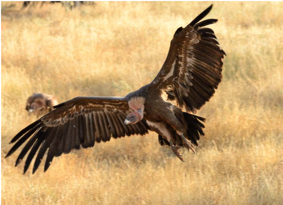
Buitre leonado, acudiendo a un comedero. (Foto: Héctor Miguel Antequera. 6-9-2013.) (Fotografía publicada en la Hoja Informativa N° 40 sobre el Refugio, página 369.)