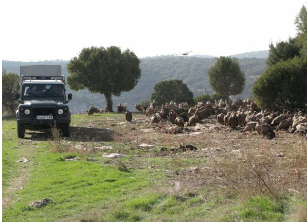
El festín observado desde la caseta