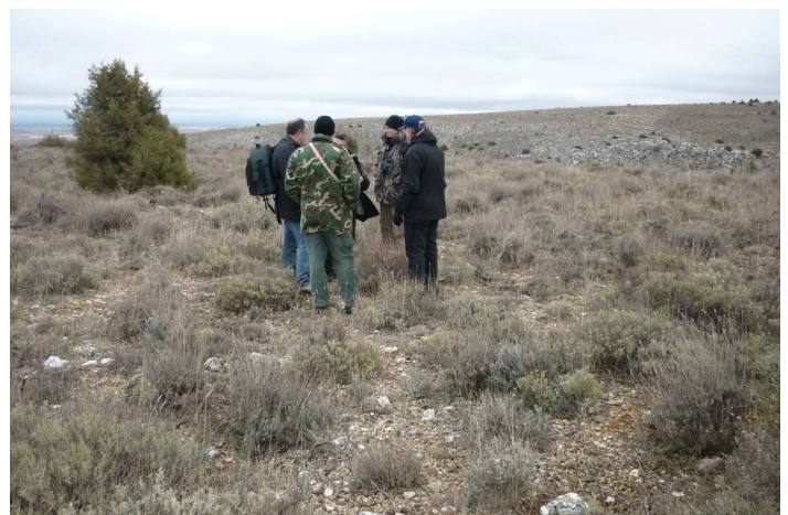
En el páramo del sureste. ©Elías Gomis