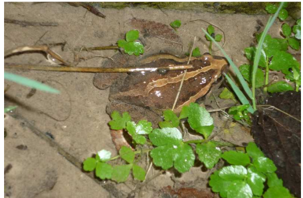
Sapillo Pintojo en la Fuente de la Vega.