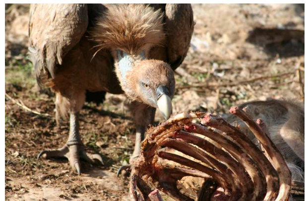
Algunas imágenes del festín.