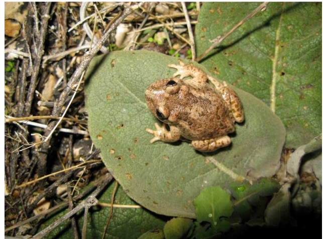
Sapo partero.

18:45 Un ex. de Sapo Partero en la calzada.