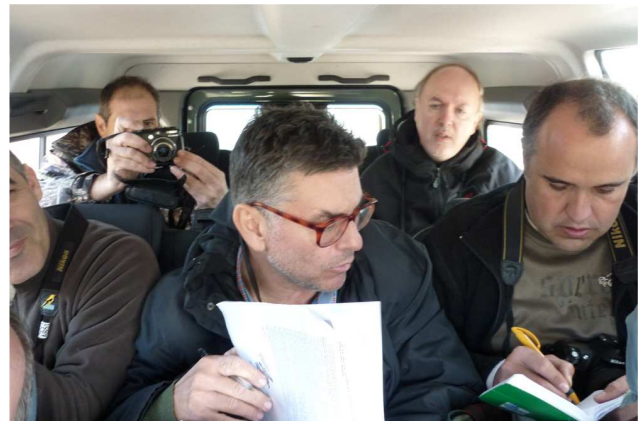
Regresando del comedero.

18:00 Mochuelo Europeo (1 ex.) sobre montón de piedras.