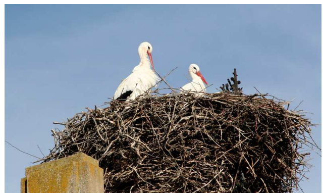
Cigüeñas Blancas en el nido de la iglesia de Montejo.