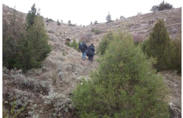
Barranco de Valdebejón.

12:14 Jilguero (3 ex.). Cernícalo Vulgar. 12:33 Cogujada Montesina. 12:35 Perdiz Roja (mín. 3 ex.). 12:36 Cernícalo Vulgar Zorzal Charlo. 12:38 Perdiz Roja (8 ex.). 12:41 Collalba Negra (oída). 12:43 Curruca Rabilarga. 13:05 Pito Real. 13:15 Mirlo Común. Pito Real. 13:23 Petirrojo. 13:24 Herrerillo Común. 13:29 Búho Real (seguramente ♀) vuela desde una roca y remonta el barranco para luego volver a descender. Lo vemos hasta en 3 ocasiones más. 14:08 Bando de zorzales (no se puede precisar la especie o especies). 14:40 Pinzón Vulgar. Pardillo Común. 14:43 Alondra Común. 14:44 Conejo de Monte. 14:45 Escribano Montesino.